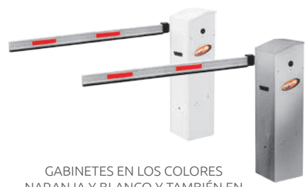
GABINETES EN LOS COLORES NARANJA Y BLANCO Y TAMBIÉN EN ACERO INOXIDABLE

JetFlex Powered by PPA INVERTER AUTOMATIZADORES ULTRARRÁPIDOS