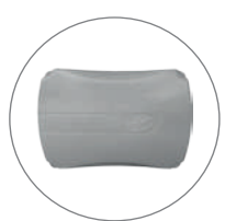
COMPATIBLE CON NO-BREAK*