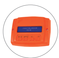
CONFIGURABLE POR PROG*